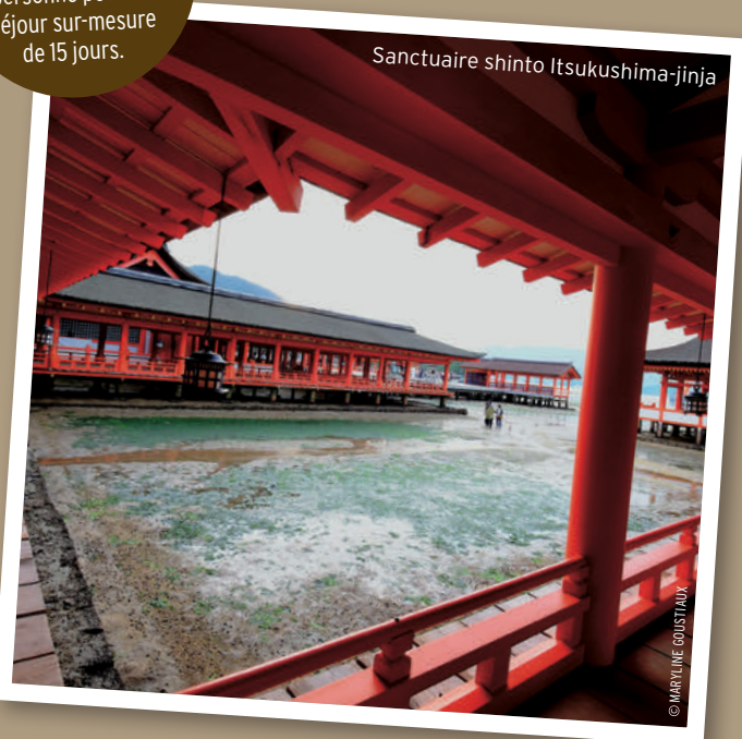
Sanctuaire shinto Itsukushima-jinja

à partir de 3 500 euros par personne pour un séjour sur-mesure de 15 jours.