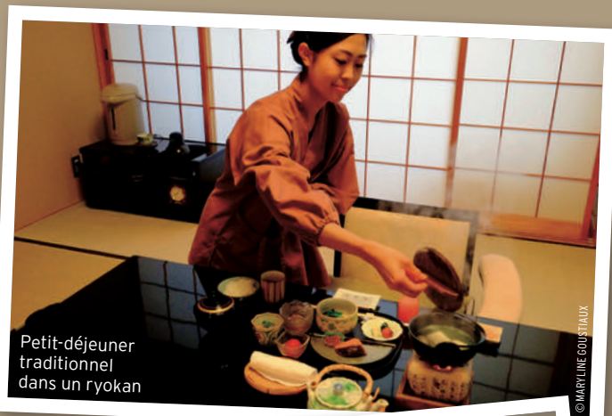
Petit-déjeuner traditionnel dans un ryokan

Shirakawa-go est connu pour ses maisons de type gassho inscrites à l'Unesco”