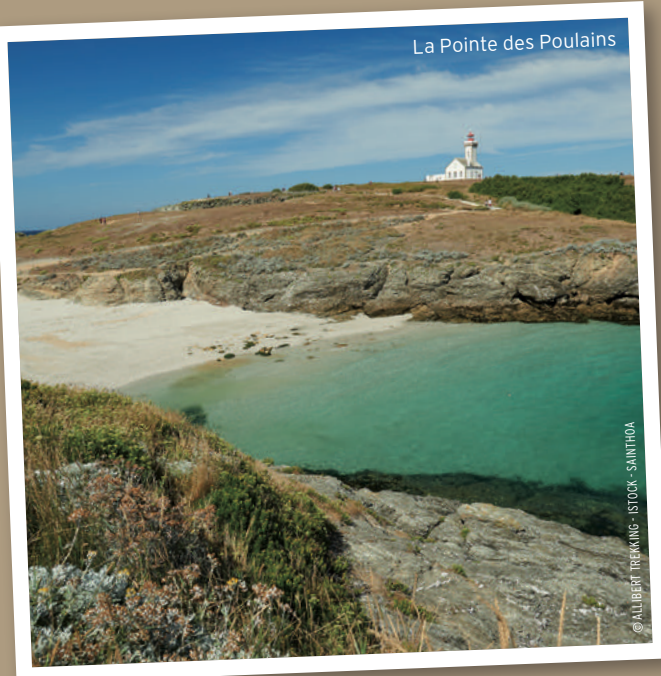
La Pointe des Poulains

Criques sauvages, dunes de sable, falaises abruptes sculptées par l'océan, lande de bruyères rases unique en Europe, campagne verdoyante... Belle-Île offre une palette de pay-