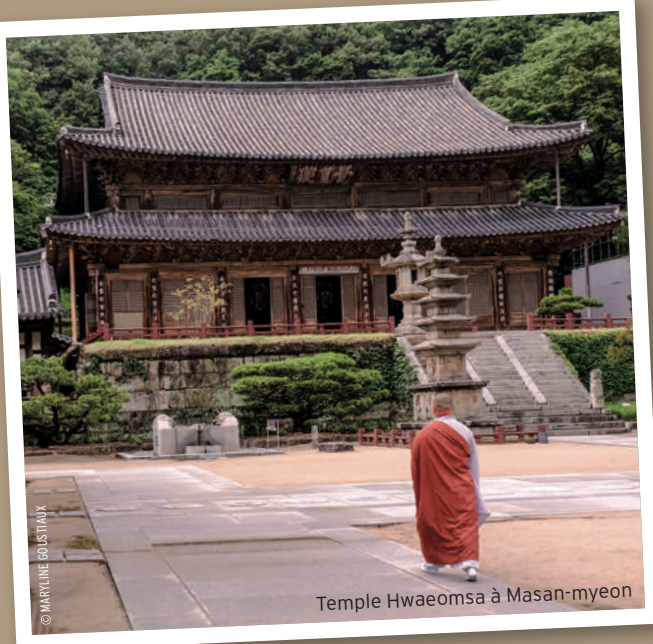
Temple Hwaeomsa à Masan-myeon

“C’est un pays peu visité! La Corée s’est ouverte au tourisme très tardivement. On connaît de plus en plus la Corée à travers la k-pop, le cinéma et les séries. L’autre point fort réside dans l’équilibre entre la culture et la nature. La nature est très présente en Corée. Il y a de nombreux parcs nationaux, même à une heure du centre de Séoul. On trouve souvent des temples, nichés au milieu de ces espaces naturels. Ce pays se caractérise aussi par le contraste entre le côté très avant-gardiste de Séoul et l’ambiance plus authentique dans les villages. Parmi les autres avantages à mentionner: il s’agit d’un petit pays. On peut le parcourir d’un bout à l’autre rapidement. C’est simple de se déplacer en train et en bus sur place. C’est une destination qui attire les familles. Ce sont souvent les ados qui poussent leurs parents à faire un voyage en Corée. En général, on atterrit à Séoul où l’on peut passer 3 ou 4 jours. La capitale est elle-même un concentré de traditions et de modernité. Les maisons hanok traditionnelles de Bukchon, les palais impériaux de Gyeongbokgung et Changdeokgung côtoient le quartier branché de Hongdae et les boutiques chics de Gangnam. Même s’il est touristique, le quartier d’Insadong mérite que l’on s’y attarde pour son temple bouddhique Jogyesa, ses salons de thé et ses boutiques d’artisanat.