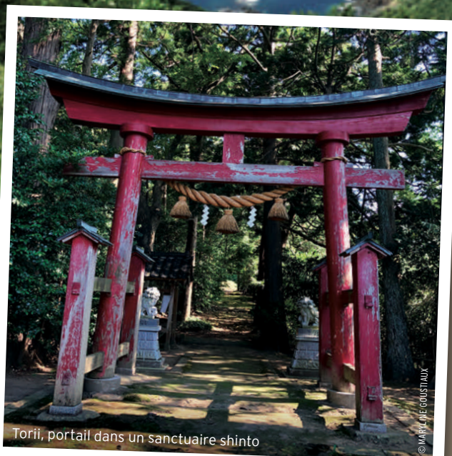
Torii, portail dans un sanctuaire shinto