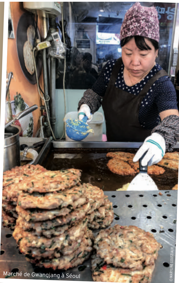
Marché de Gwangjang à Séoul