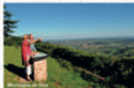
Montagne de Dun