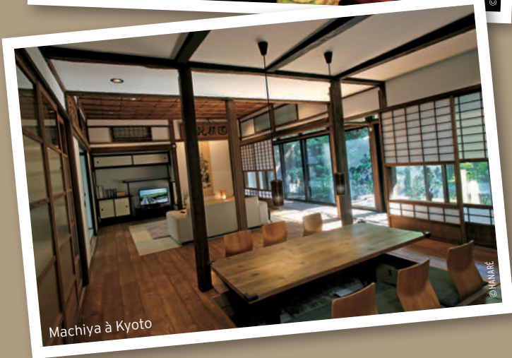
Machiya à Kyoto