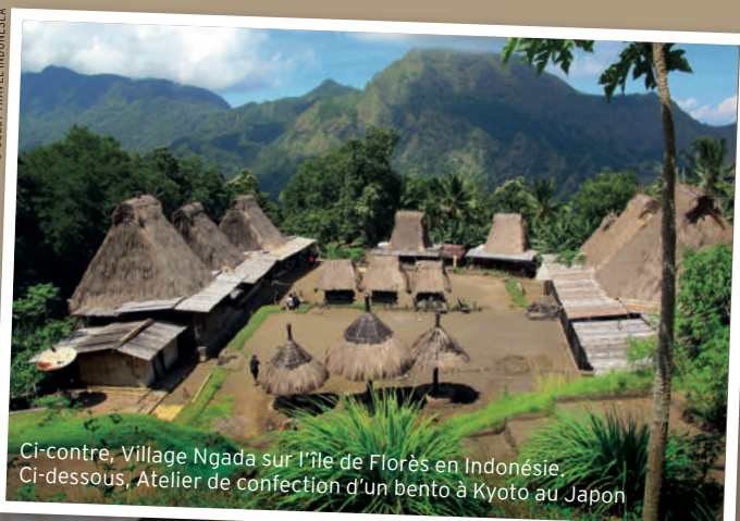
Ci-contre, Village Ngada sur l'île de Florès en Indonésie. Ci-dessous, Atelier de confection d'un bento à Kyoto au Japon