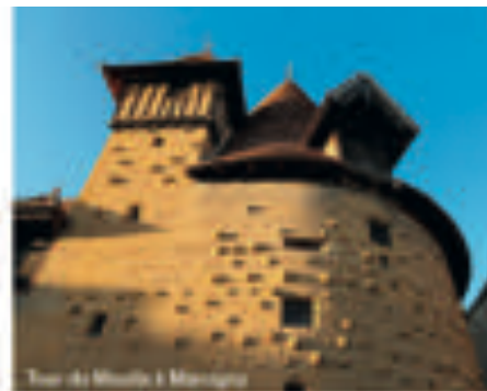
Tour du Moulin à Marcigny