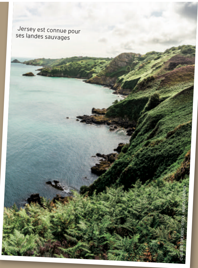
Jersey est connue pour ses landes sauvages