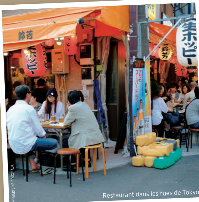
Restaurant dans les rues de Tokyo