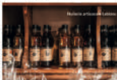
Céramique artisanale Leblanc