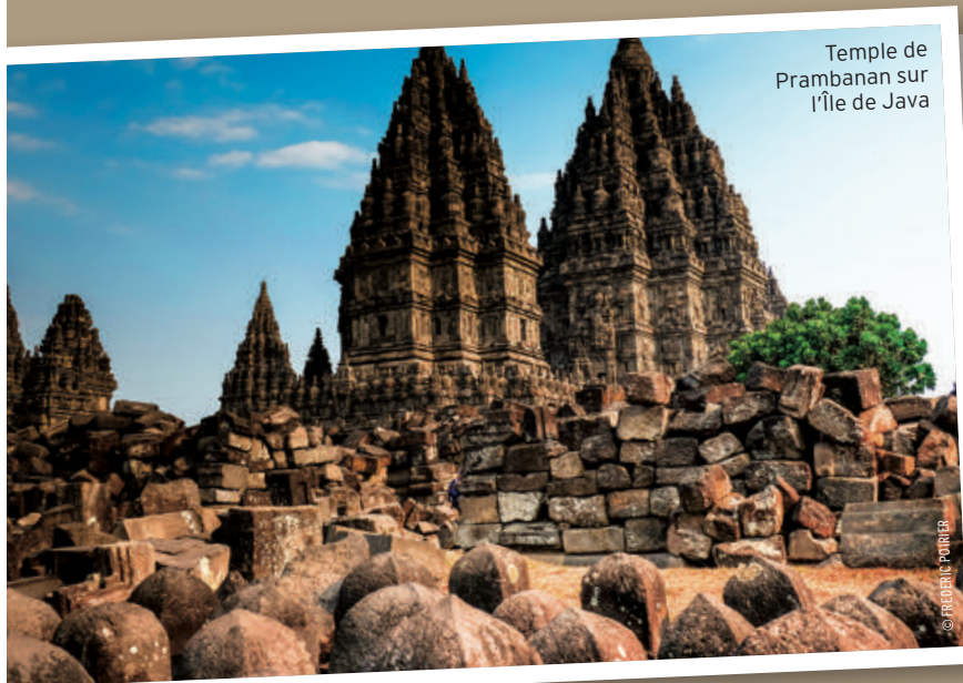
Temple de Prambanan sur l'île de Java