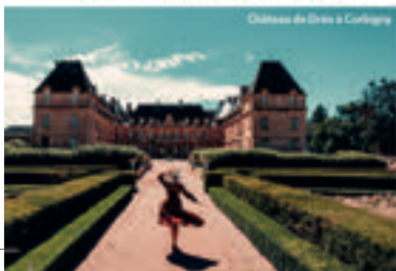
Château de Dreie à Corigny